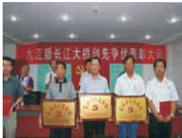
分公司九江二桥项目基层党支部工作获全线第一

《大学》里有云：“物格而后知至，知至而后意诚，意诚而后心正，心正而后身修，身修而后家齐，家齐而后国治，国治而后天下平。”他是一个纯正的道统继承者，以个人修身而拥有令人折服的儒者风采。这，也是我向往和倾慕