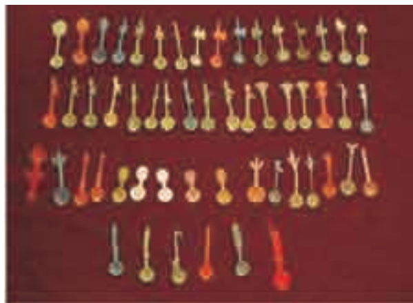
这些小勺子，在当年的小学生中可是引起了一股收藏热。

冠生园出品的大白兔奶糖绝对是80后心中最最经典的零食，正如包装上的标语“大白兔，来自中国的礼物”。无论60s、80s，都有一只跳跃的白兔伴随着我们走过童年岁月。印象中大白兔奶糖包装很简单朴素又温馨，只要轻轻打开包装，便能闻到浓郁的奶香味、口感醇厚又弹性十足，还有丰富的牛奶营养。健康又美味的形象正是它经久不衰的关键。大白兔奶糖的出现在那物质短缺的年代，圆了很多人的零食