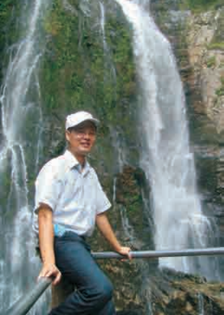
放松心情融入自然