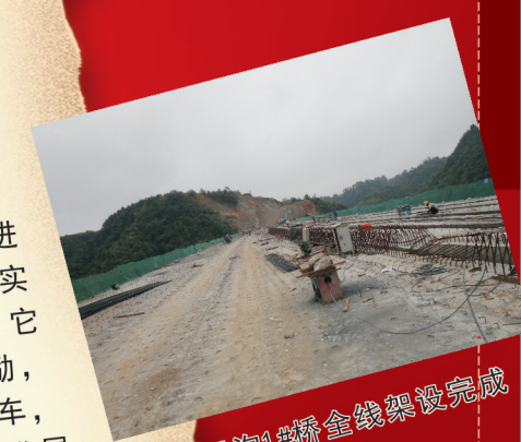
▲银沟1#桥全线条架设完成