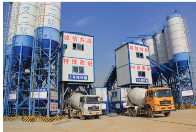
图为1号搅拌机正在出料。

经过前期的桥墩桩位反复测定、机械设备安装调试、施工技术组织等准备，南岸引桥首根钻孔桩得以顺利开钻，据了解，2日当天共进行了6根钻孔桩造浆开工工作。(综合办)