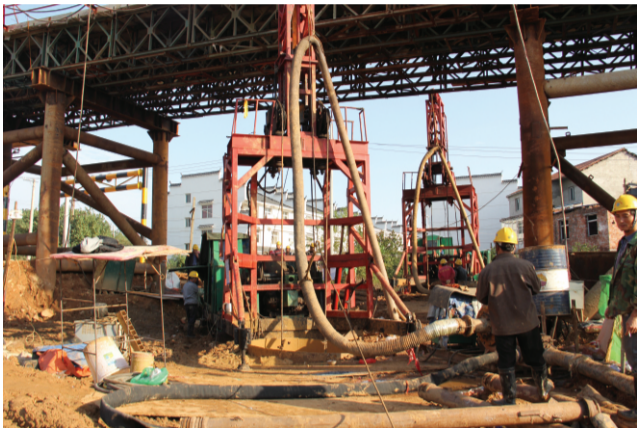
图为跨武金堤高架桥8号墩正在进行冲击反循环钻机钻进。

(本报讯)11月2日上午，武汉沌口长江公路大桥南岸引桥首根钻孔桩顺利开钻，标志着大桥南岸工区引桥工程正式开工。