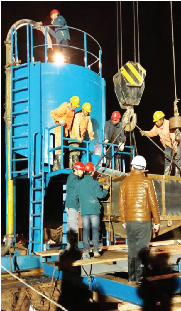
图为11月10日凌晨，北岸施工现场灯火通明，首件桩基浇筑进行中。

(本报讯)11月9日22：30，北岸分部施工现场灯火通明，随着现场负责人“放……”的一声口令完成拔塞，“导管埋深2.3米”，沌口长江公路大桥首根钻孔桩顺利完成了首封，至10日凌晨两点，首件桩基成功浇筑。