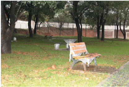
深处是林间木椅石凳