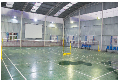
门内是室内活动中心，羽毛球场、乒乓球台、点唱机。